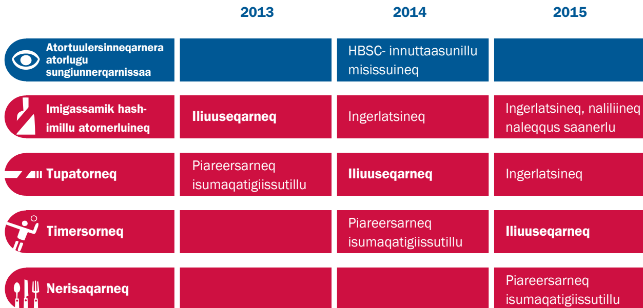
Figur 7.1. Inuuneritta II-mut - 2013-2019 pilersaarutit.

naveersaartitsiniarluni iliuuseqarnerit, tamatumunnga aningaasaliissutaareersunit aningaasalersoneqassapput.